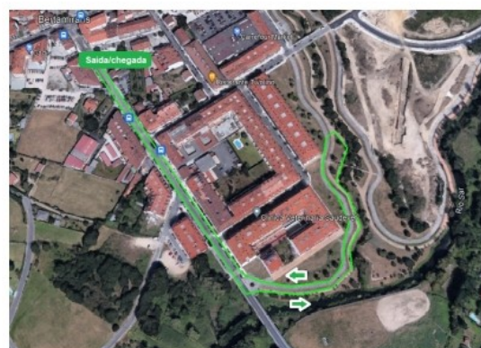
Percorido de 1.300 metros