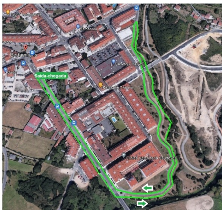
Percorido de 1.900 metros