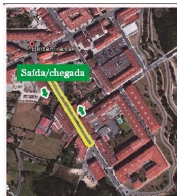
Percorido de 350 metros