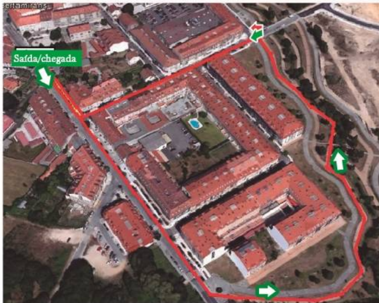
* Percorrido de 1000 metros