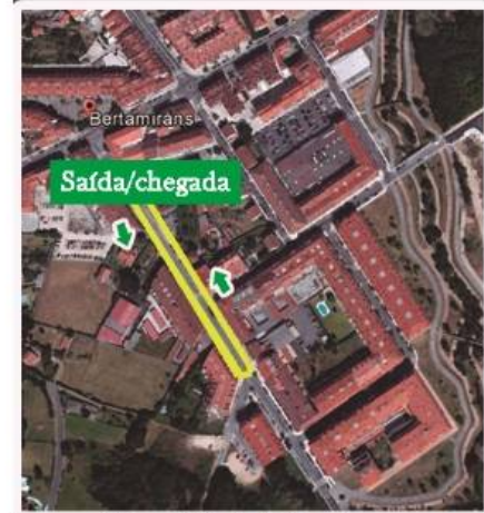
* Percorrido de 350 metros