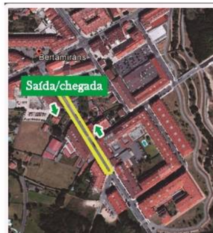
* Percorrido de 350 metros