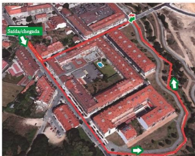
* Percorrido de 1000 metros